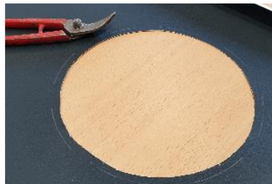
4 • Vous coupez sans faire de «gendarme».