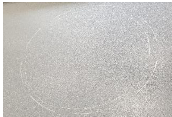
3 • Le tracé ( Vers l'intérieur pour la coupe et l'extérieur pour le collet battu).