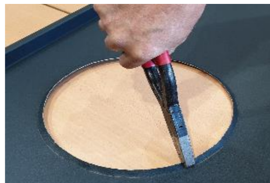
5 • Réalisation du collet battu à l'aide d'une pince plate à charnière emboutie. ( 5 à 7 mm)