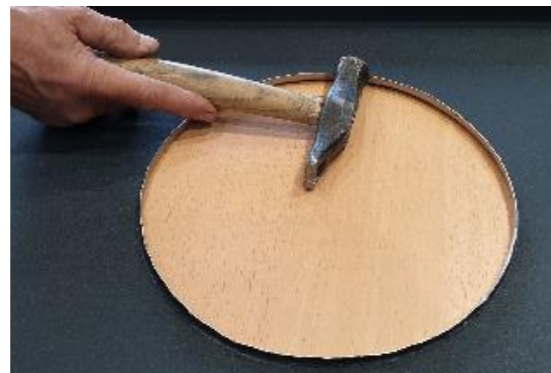
6 • Finalisation du collet-battu à l'aide d'un marteau à garnir.