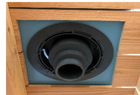
11 • Découpez un chevêtre de 350 x 350 mm