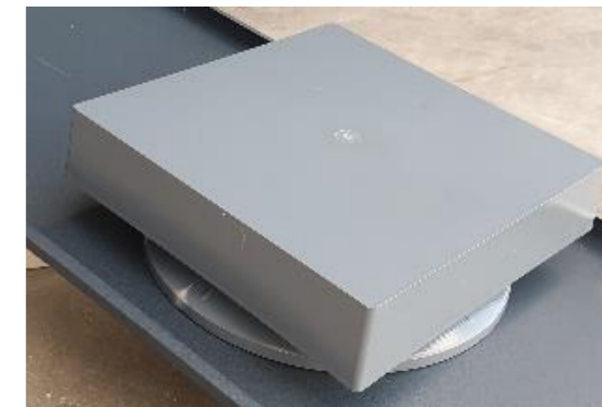
12 • DR'WIND. Se personnalise en habillant le chapeau de la couleur de votre toiture.