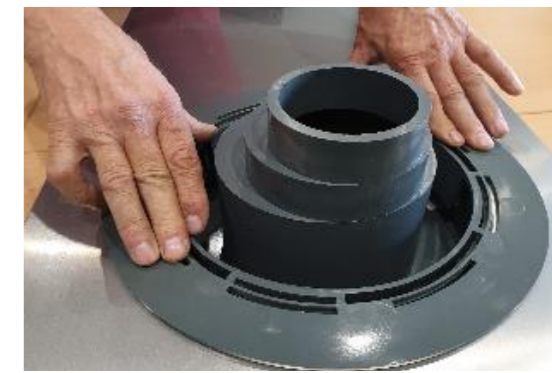
10 • Vous clipsez l'ensemble. Attention de bien positionner le chapeau en suivant les marques.