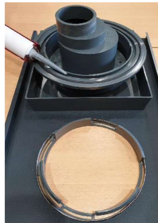
8 • Positionnement du MS Polymère dans l'encoche du collet-battu.