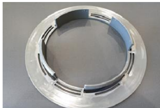
1 • Vous positionnez la base/gabarit.

Grâce à ces 3 barrières de protection : -Collet de battu -Joint torique en boudin mousse EPDM -Joint MS Polymère R'WIND assure une parfaite étanchéité.