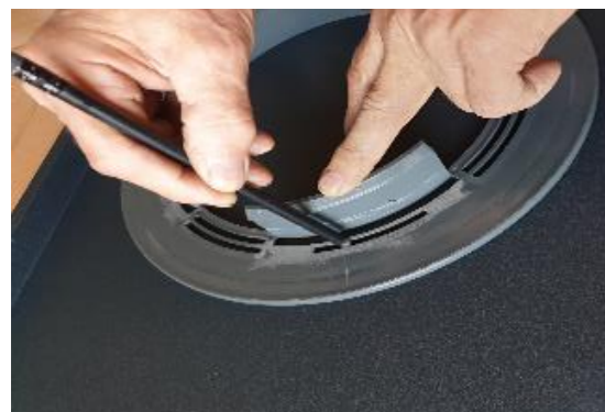
2 • Grâce aux encoches, vous tracez le collet battu et la coupe.