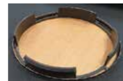
7 • Pose de la base servant au clipsage.